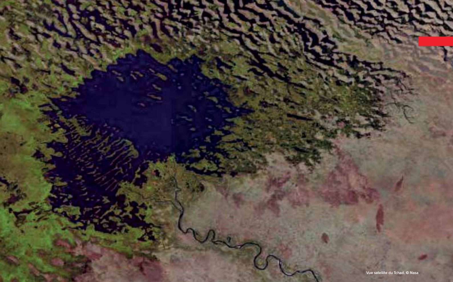
Vue satellite du Tchad.