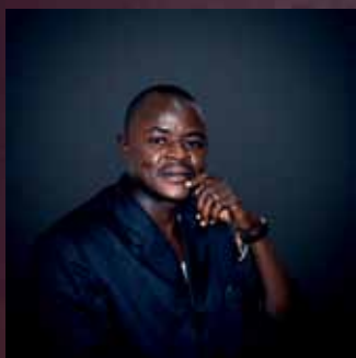
Par Daouda Émile Ouédraogo