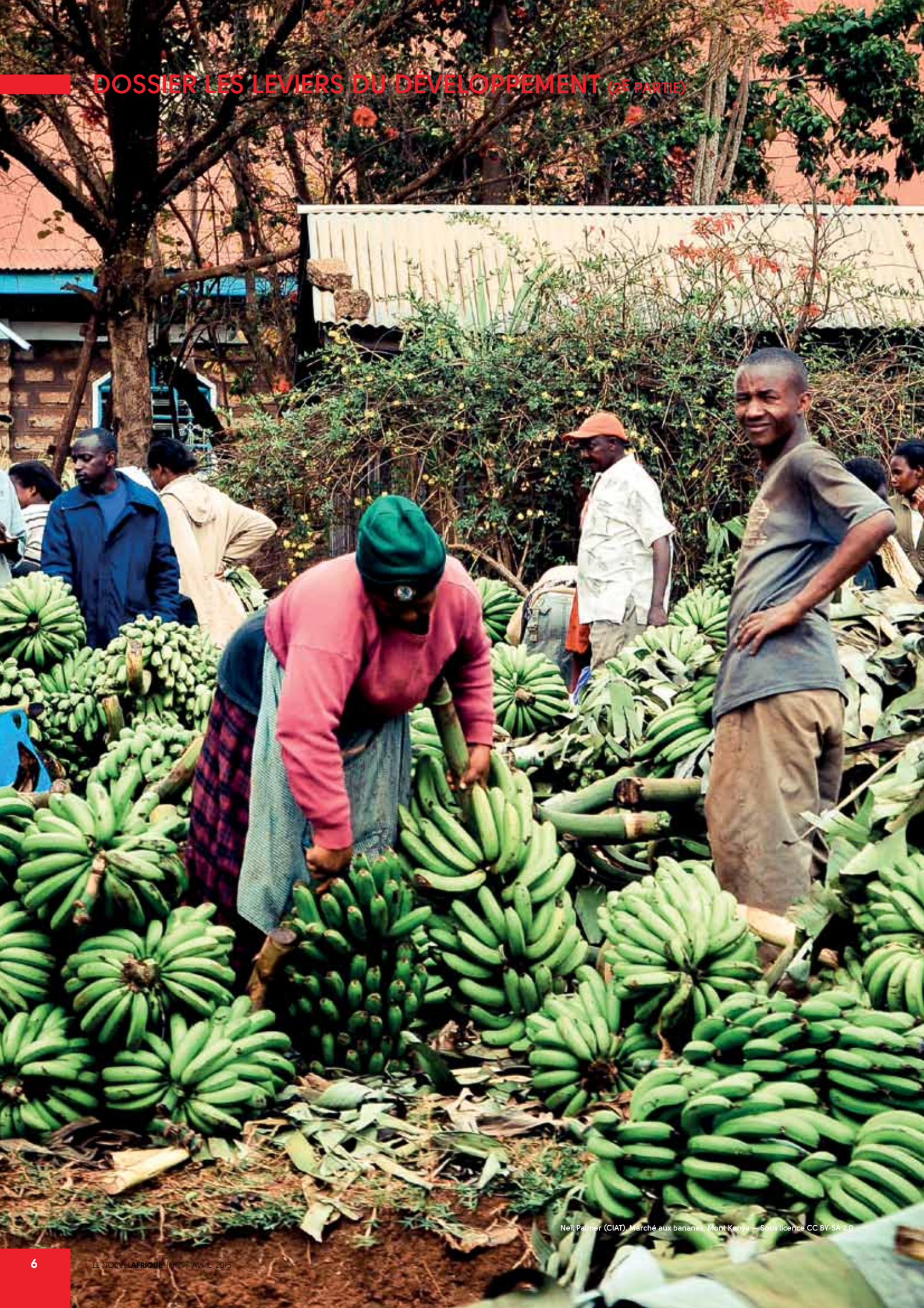
Neil Palmer (CIAT) / Marché aux bananes, Mont Kenya — Sous licence CC BY-SA 2.0