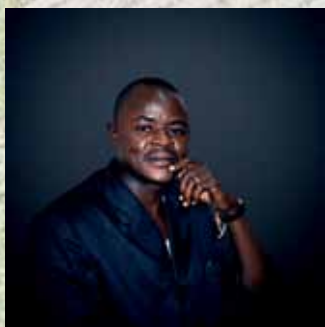
Par Daouda Emile Ouedraogo