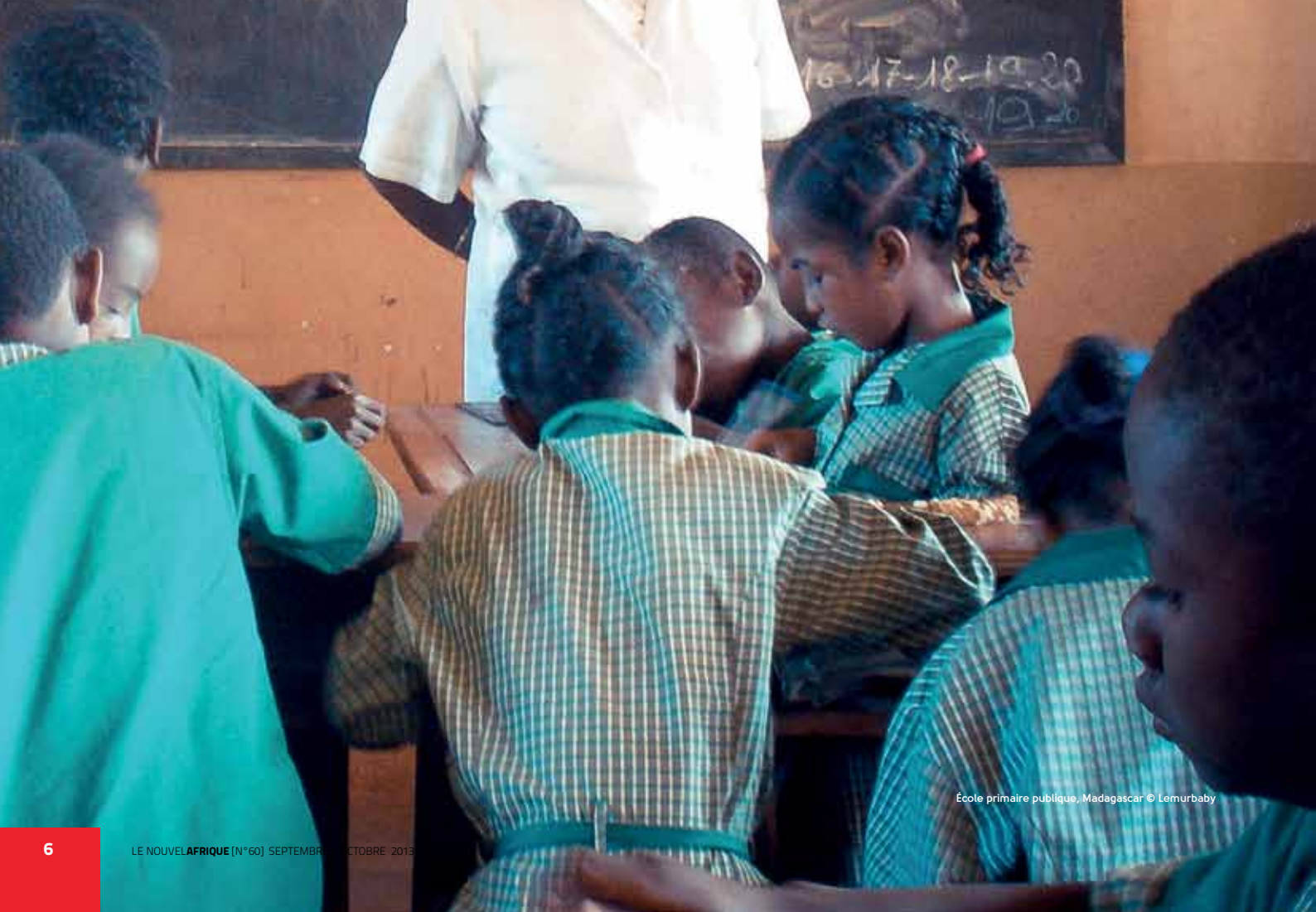
École primaire publique, Madagascar