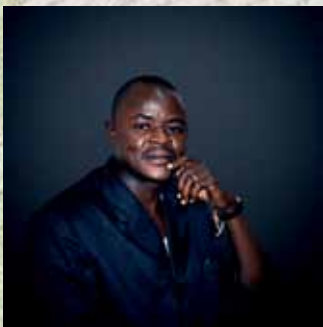
Par Daouda Emile Ouedraogo