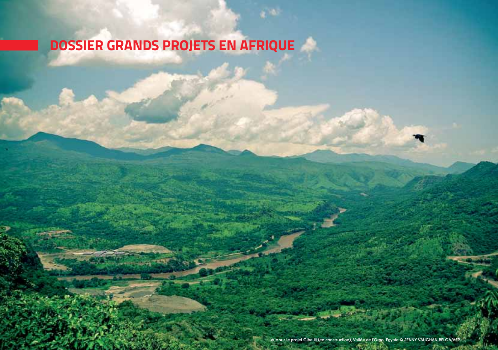
Vue sur le projet Gibe III (en construction), Vallée de l'Omo, Égypte