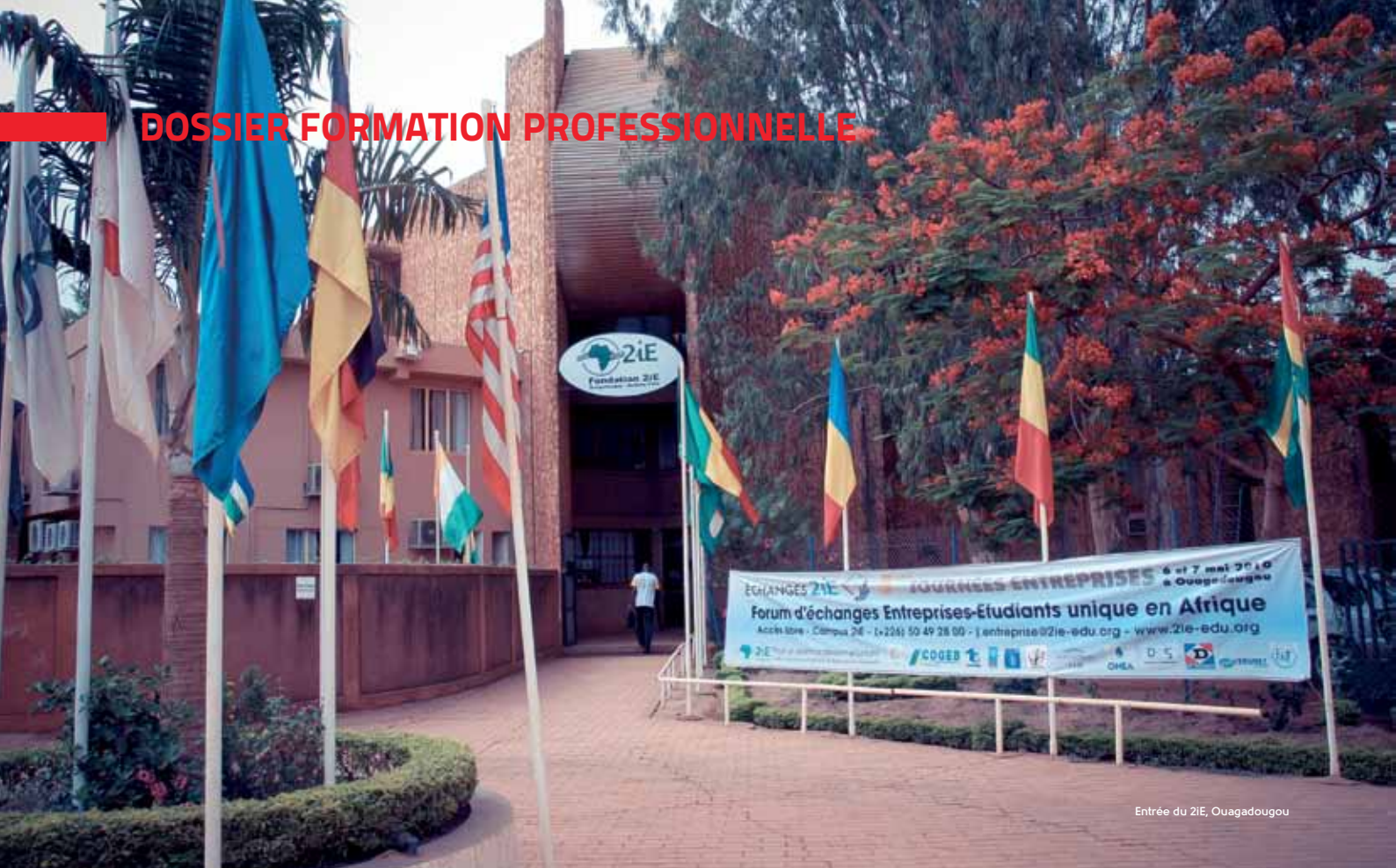
Entrée du 2iE, Ouagadougou