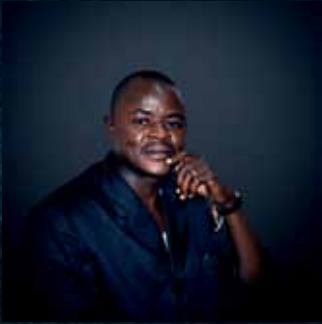
Par Daouda Émile Ouédraogo