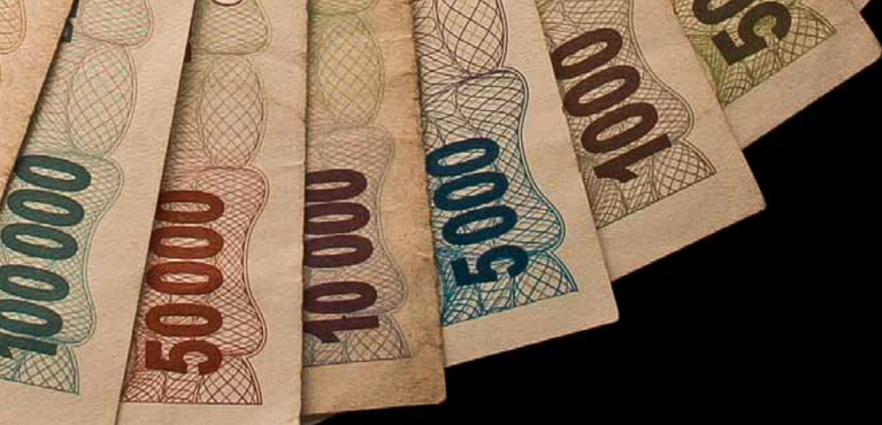
"Zimbabwe Hyperinflation 2008 notes" par Discott - Public Domain

à moindre coût. La réussite économique passe par la promotion de la santé. Un individu en bonne santé a un meilleur rendement que celui qui est malade. Une population en bonne santé favorise l'épanouissement de l'économie et permet une meilleure croissance. Ladite croissance se fera avec les différentes réformes économiques que plusieurs pays ont enclenchées. C'est déjà un bon signe. Il faudra poursuivre et peaufiner ces actions en 2015. C'est à travers la création de cadre propice à la pratique des affaires que les investisseurs pourront avoir le courage de mettre leur argent dans des initiatives profitables. Le rapport Doing business de 2015 prévoit de nouvelles opportunités pour les économies africaines.